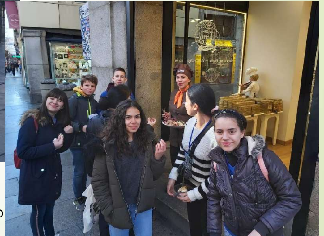
Dia 3 Peddypaper em Madrid - à descoberta do centro histórico