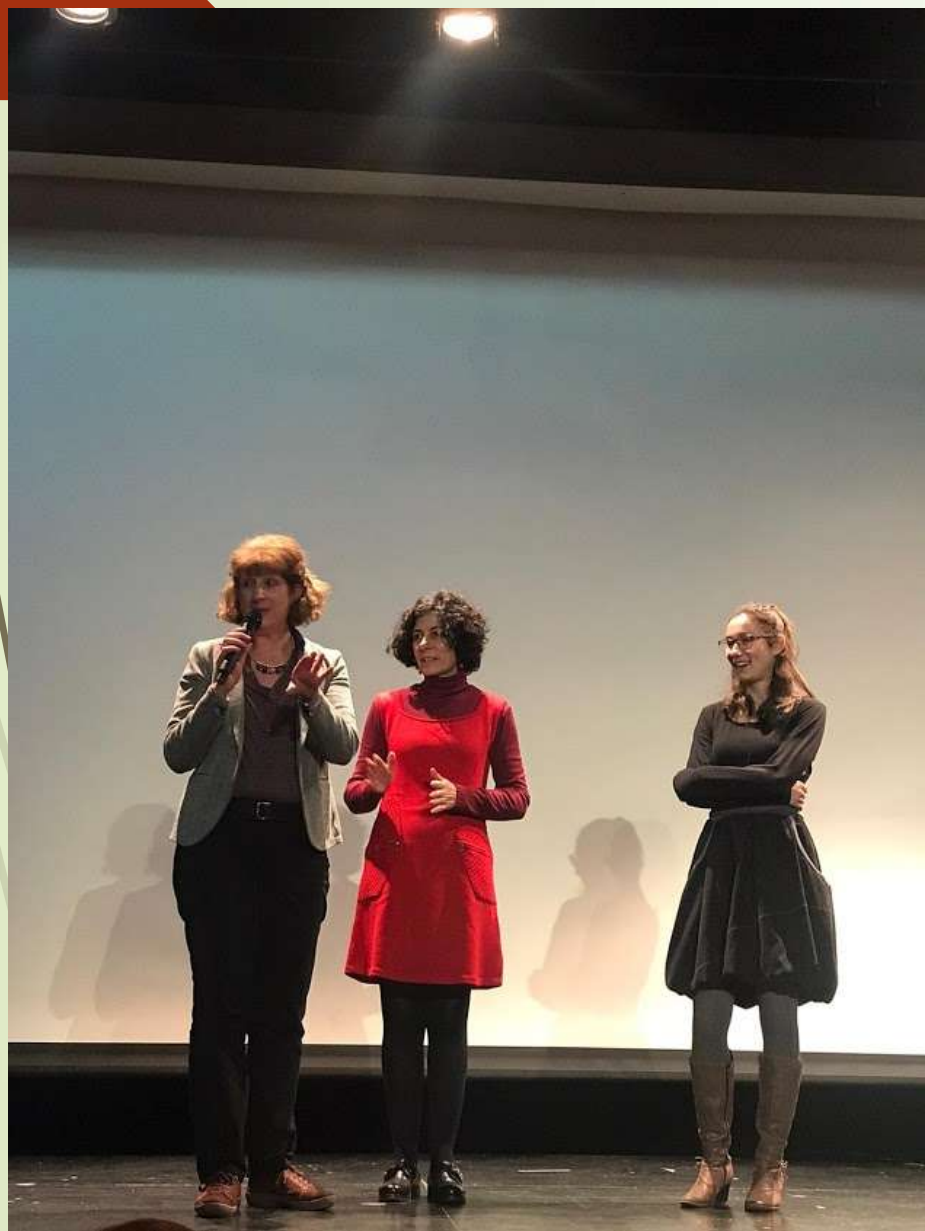
Cerimónia de despedida